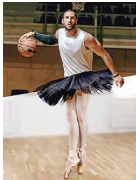
Was ist dein Lieblingssport, Basketball oder Ballett? Bei der Kampagne „Sportmeister“ kann man dem Spaß an der Bewegung freien Lauf lassen und sich dabei auch mit Profis messen.

In einer neuen Kampagne sucht die sportliche Krankenkasse zu dem bundesweit den „Sport-