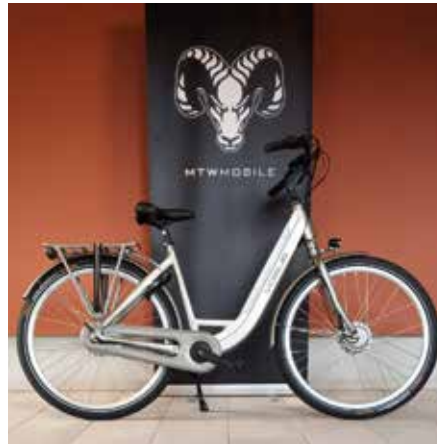
Modell „Mestengo“ 1.669 €