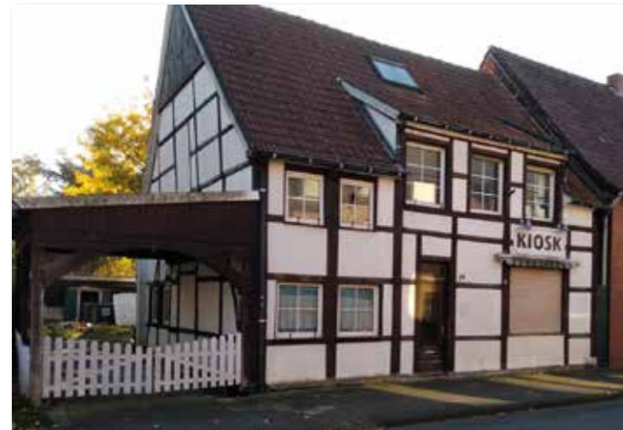
Um die Parkplatzsituation an Schule und Kindergarten zu entschärfen, wurde dieses Grundstück ins Spiel gebracht.

Baugebiet in Hoetmar und eine weitere Verzögerung würde Bauwillige dazu bewegen, sich in Nachborte zu orientieren“, meinte beispielsweise Stephan Brinkmann. Darüber hinaus sollten aber auch weitere Flächen avisiert werden. Hierzu zählt auch das Gelände der ehemaligen Gärtnerei Bureck. Alle waren sich einig, dass der Anblick für einen Ortseingangsbereich unwürdig ist und hier schnellstmöglich Lösungen gesucht