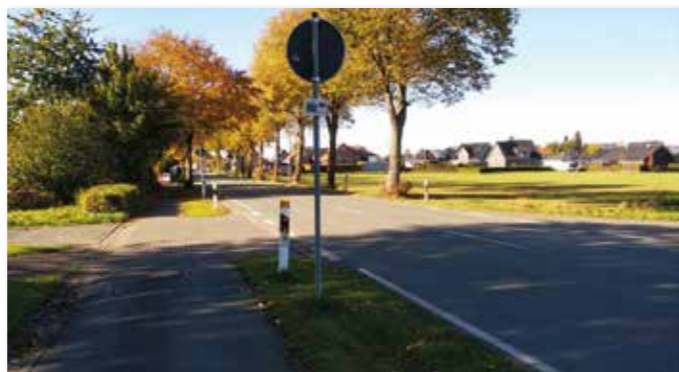
Es kamen auch geplante Verkehrsoptimierungen zur Sprache.