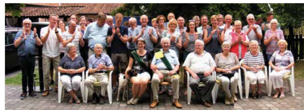
Gruppenfoto vom letzten Treffen der ehemaligen Majestäten.

EUER VORSTAND DES SCHÜTZEN- UND HEIMATVEREINS