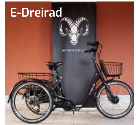
E-Dreirad Modell „Tri-Velo“ 2.599 €