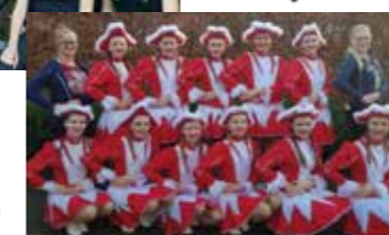
Foto von 2020, im alten Kostüm

Du magst Karneval, schaust dir gerne die Tänze der Tanzgarde an und möchtest uns unterstützen, unseren Traum von einem neuen Outfit zu verwirklichen?