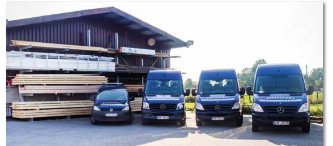
Nicht nur der Fuhrpark ist im Laufe der Zeit gewachsen – auch das Betriebsgelände wurde 2011 um 1000 m² Außenfläche erweitert.

Der Mitarbeiterstamm umfasst neben den Inhabern