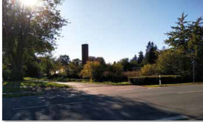
Blick auf das ehemalige Bureck-Gelände.

Paul Schwienhorst, der die Veranstaltung moderierte, wies aber auch auf zwei weitere Punkte hin. „2015 haben wir bereits eine Schulwegsicherung in Form von Fahrbahnkeilen für die Dechant-Wessing-Straße beantragt. Seitdem taucht der Punkt regelmäßig im Haushalt auf, aber es passiert nichts“, ärgerte er sich über