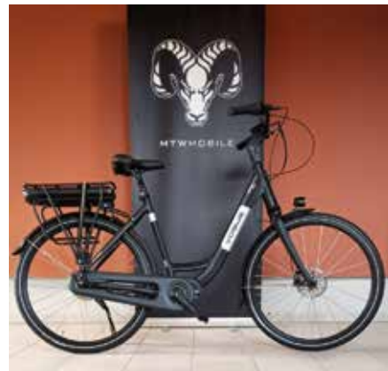
Modell „Infinity“ 1.980 €