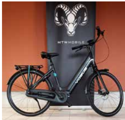
Modell „Excellent“ 2.399 €