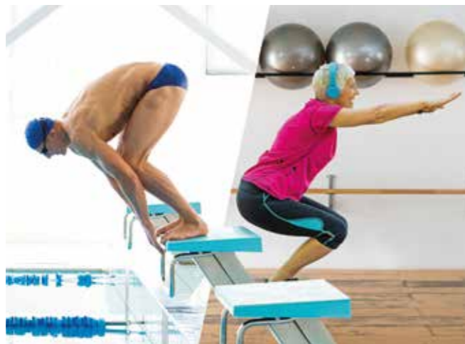
Zweimal die Haltungsnote 1: Bei der Kampagne „Sportmeister“ rufen Challenges und Wettbewerbe zum Mitmachen auf. Es geht um körperliche und mentale Fitness – aber vor allem um Spaß und Bewegung.

Bevor Trainingsanfänger über-eilt ihre Turnschuhe schnüren, sollten sie in Ruhe überlegen, welche Belastung für sie geeignet ist. Auch wer bereits regelmäßig aktiv ist, sollte stets darauf achten, dass er die Intensität des Trainings seinem Gesundheitszustand anpasst und den Körper mit ausreichend Flüssigkeit und Nährstoffen versorgt. Die Krankenkasse Viactiv etwa hat einen sogenannten Activ-O-Mat entwickelt. Mit dem kostenlosen Online-Tool kann man mit nur wenigen Klicks aus 60 Sportarten diejenigen herausfinden, die am besten zu einem passen. Von Klassikern wie Fitness oder Wandern, beliebten Ballspielen bis hin zu Sporttrends wie Boul-