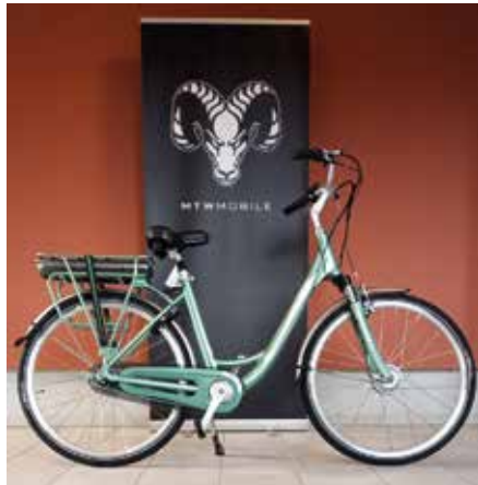
Modell „Basic“ 1.450 €