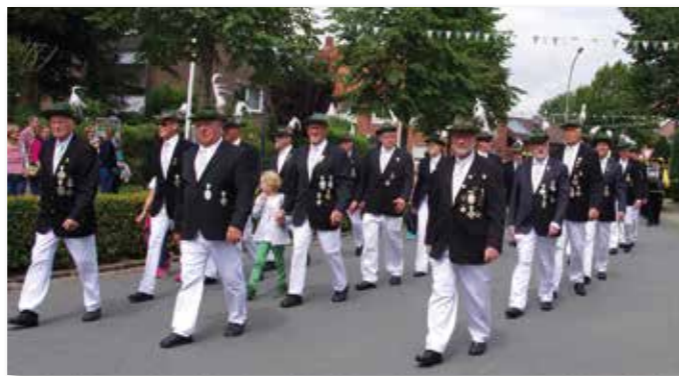
Antreten der ehemaligen Könige.

Hierzu laden wir Samstag, den 27. November, ab 20.00 Uhr natürlich vor allem alle unsere Majestäten, aber natürlich auch alle Mitglieder und Freunde des Vereins, in den Eventsaal Bütfering unter der Leitung unseres Festwirtes Strohbücker ein. Das Fest der Majestäten soll dazu dienen, schnell wieder eine Art Schützengeist in unserem Verein aufleben zu lassen und nach all den schützenlosen Monaten das Gemeinschaftsgefühl unseres Vereins zu stärken.