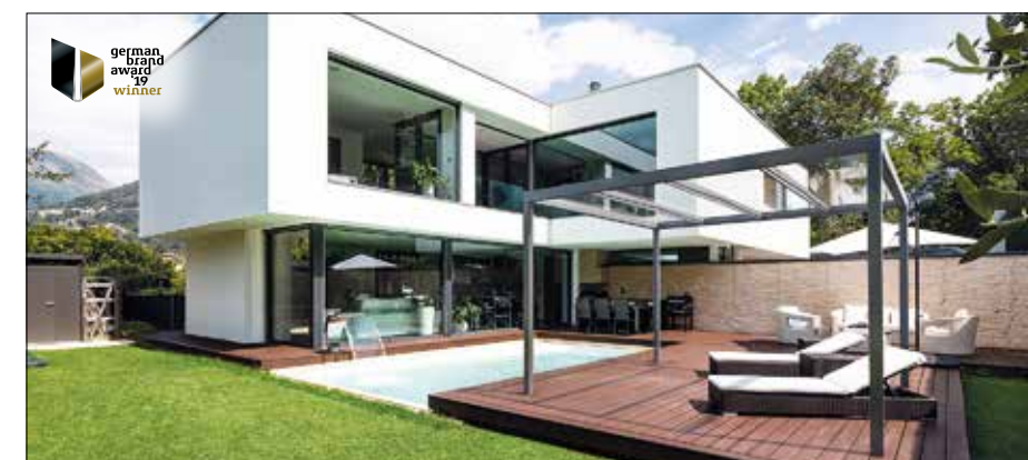
VERANDACUBE: DAS EINZIGE ECHTE FLACHDACH

Öffnungszeiten: Mittwoch bis Sonntag 11.00–22.00 Uhr (Montag und Dienstag Ruhetag)