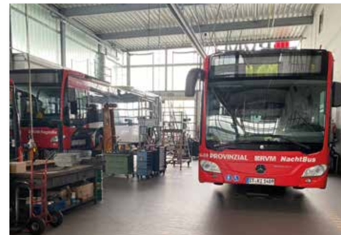
Blick in die Werkstatt der RVM Lüdinghausen.

grund. Auch konnte ein Blick in die Werkstatt am Betriebsgelände der RVM in Lüdinghausen geworfen werden. Am Nachmittag tra-