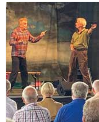
Auftritt der „Bulle männer“ bei der Jubiläumsveranstaltung der RVM „35 Jahre Bürgerbus“.

Aber auch das Vereinsleben wird wieder neu aktiviert. So trafen sich alle aktiven Fahrer mit ihren Partnern im Juni zum traditionellen Sommergrillen. Bei angenehmen Temperaturen und leckerem Essen vom Grill durch die Fleischerei Minke gab es nun endlich wieder einen intensiven Austausch zum Thema Bürgerbus und zu anderen Themen des Dorfes und darüber hinaus, da auch inzwischen zusätzliche Fahrer aus Everswinkel und Sendenhorst dabei sind.