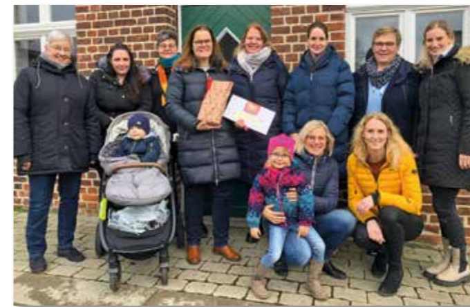
Die HTTG bedankt sich für die großzügige Spende bei den Hoetmarer Weihnachtswichteln.