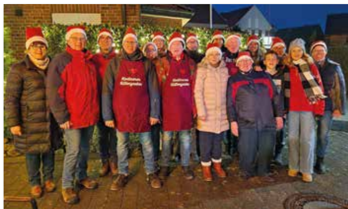
Die Nachbarschaft „Am Park“ organisiert den Hüttenzauber.