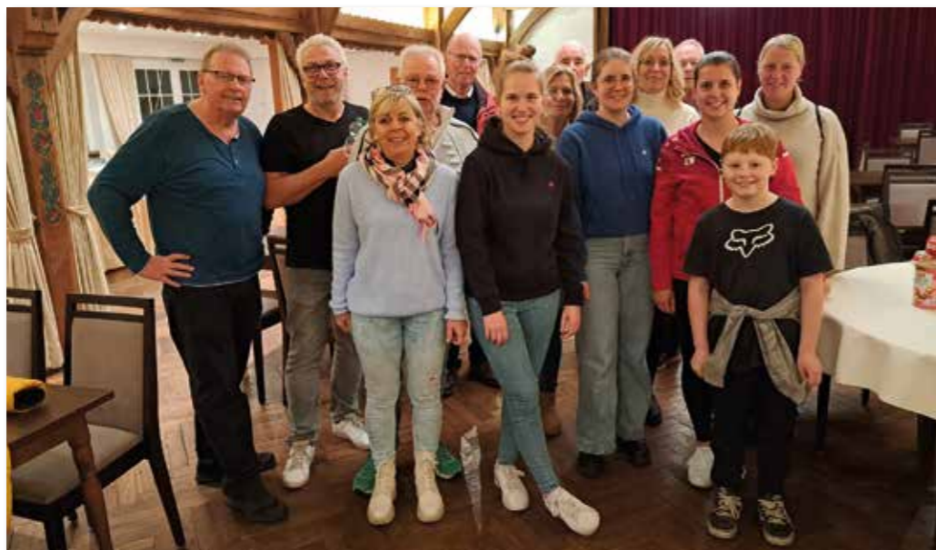
Die Helferinnen und Helfer nach dem Verpacken der Weihnachtspakete.

Schon seit Jahren schickt der Verein Enniger HILFT Kin-